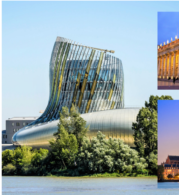
LA CITÉ DU VIN