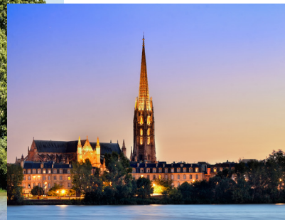
LA BASILIQUE SAINT-MICHEL

En 2021, Bordeaux était en tête du classement des villes où il fait bon vivre en famille en France. Ce titre honorifique s'explique d'abord par sa proximité avec la nature, avec des hectares de vignes mais aussi des plages de sable fin. Bordeaux propose plusieurs hectares d'espaces verts par ses jardins publics et ses espaces naturels.