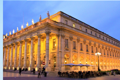
LE GRAND THÉÂTRE