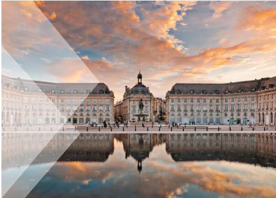
PLACE DE LA BOURSE

Depuis sept ans, la capitale girondine est en tête du classement des villes où les Français aimeraient le plus travailler. Son quartier d'affaires aux multiples entreprises en essor se fixe pour objectif d'offrir 30 000 emplois d'ici 2030. Son innovation numérique lui vaut également de figurer parmi les cités "French Tech".