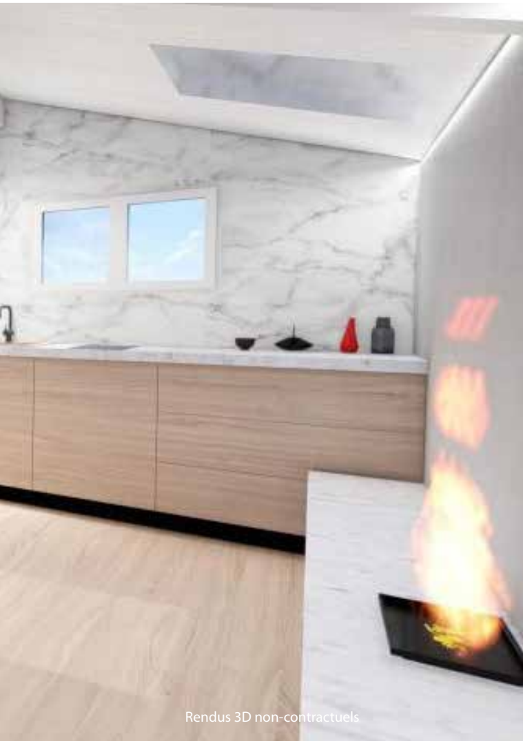
Rendus 3D non-contractuels