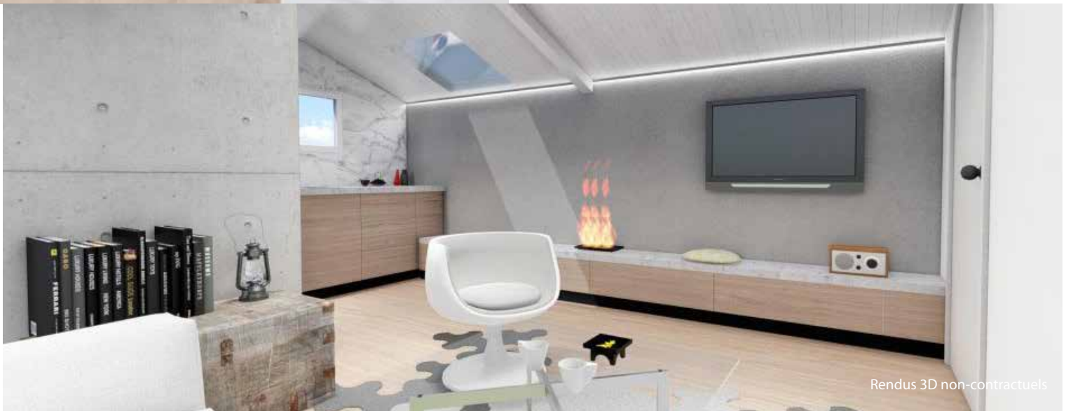
Rendus 3D non-contractuels