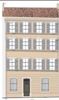
FACADE COURS SEXTIUS - PROJET